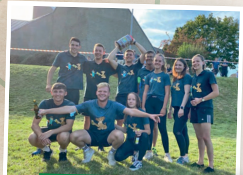
Unser Team für das Spiel ohne Grenzen: Die Kirmesbuschen & -Mädchen 2020/21