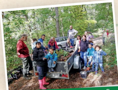
Impressionen der bisherigen Baumpflanz-Aktionen