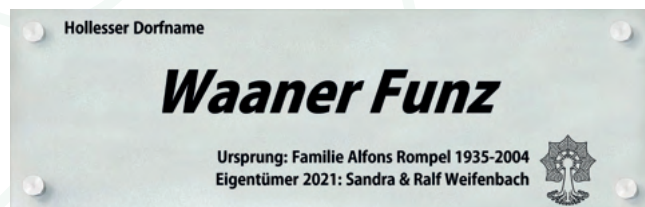
Beispiel der Schilderaktion

teausschuss hat viel recherchiert um alte Dorfnamen lebendig werden zu lassen. Um dies nach außen zu tragen, werden in den nächsten Wochen Schilder, sowohl mit den ursprünglichen Dorfnamen als auch den Namen der jetzigen Bewohner an den Häusern und an den Sehenswürdigkeiten angebracht. Eine Besonderheit von Lindenholzhausen wird so sichtbar fortgeführt und bleibt lange für viele Menschen erhalten.